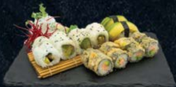
VEGITO SET 14,50 € 2 Avocado Nigiri 8 Little Buddha I-O 8 Crispy Veggie