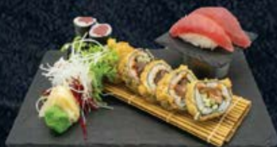
TUNA SET 16,50 € 2 Maguro, 6 Tekka Maki, 5 Tokyo Roll