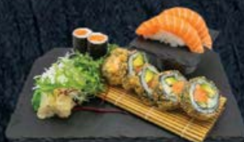
SALMON SET 14,90 € 2 Sake Nigiri, 6 Sake Maki, 5 Salmon Roll