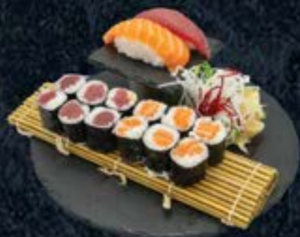
ONJI CHAN SET 11,90 € Sake, Maguro, 6 Sake Maki, 6 Tekka Maki