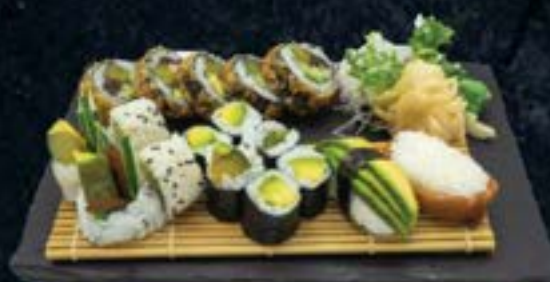
YASAI SET 13,90 € Inari, Avocado 6 Avocado Maki, 4 vegi. I-O, 5 Buddha Roll